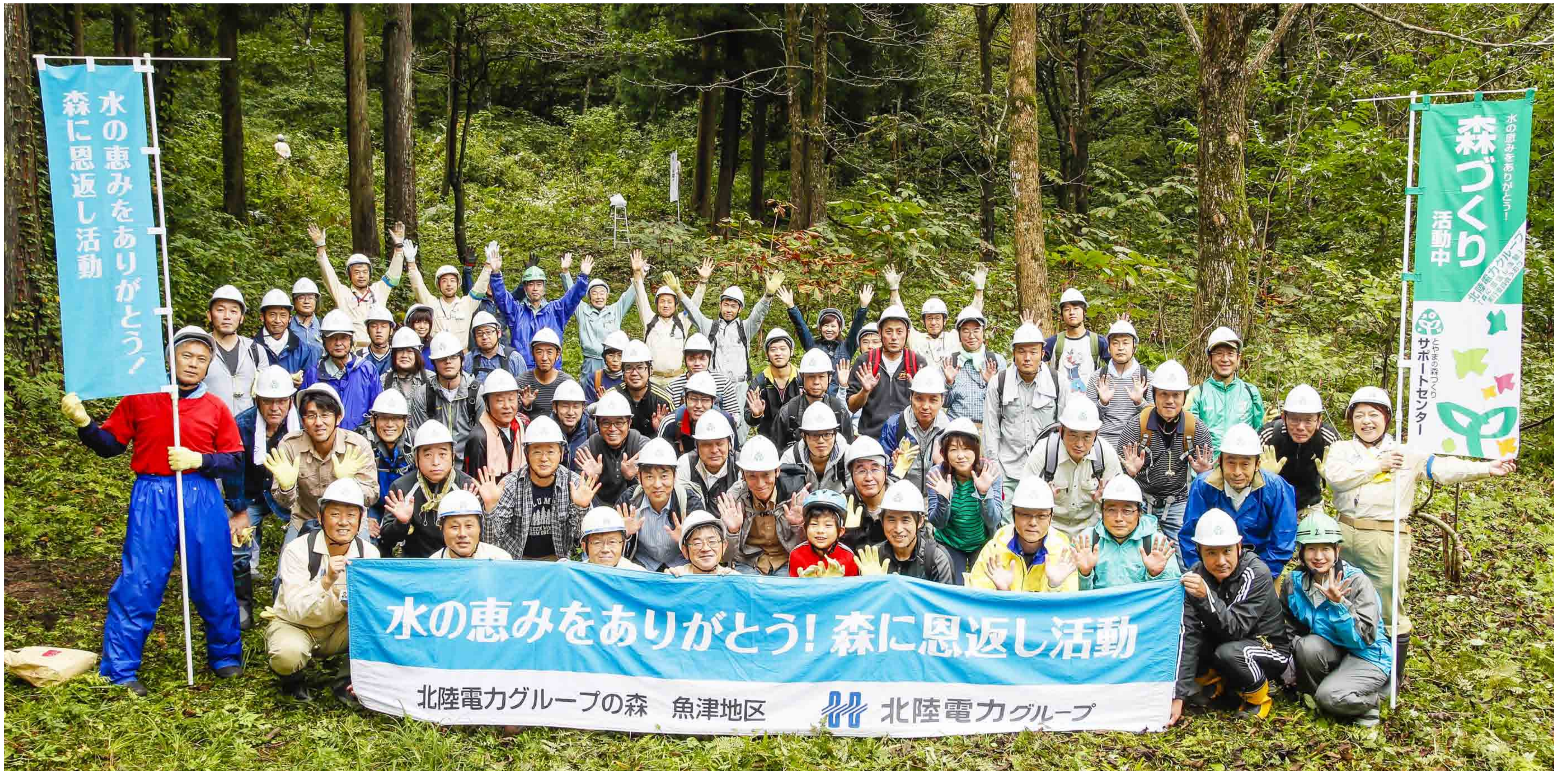
森に恩返し活動実行委員会 うおづ 78名参加

北陸電力グループは、「地域との共生に向けた活動」として、2008年度から水源かん養やCO 2 の吸収等、さまざまな恩恵を与えてくれる森に感謝の気持ちを込めて、グループ従業員とその家族が植樹や下草刈りなどの森林保全活動を魚津市三ヶ地内で行っています。