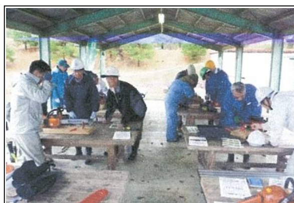
開催場所 〇〇市△△△ □□□ 地内 開催日 令和 4年 9月 13日 講習会等名 安全講習 (チェーンソーの使い方について)