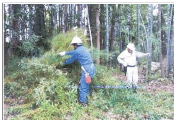
開催場所 〇〇市△△△ □□□ 地内 開催日 令和 4年 5月 10日 講習会等名 安全講習 (竹の伐採方法について)