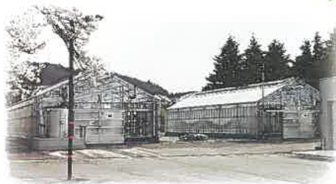
環境制御型園芸ハウス