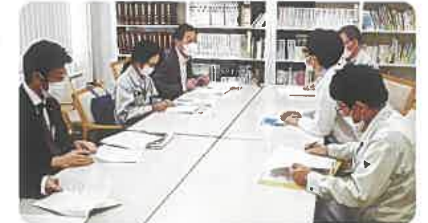
農林振興センター等との就業相談