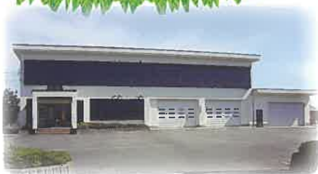
とやま農業未来カレッジ 本校舎