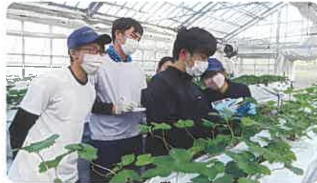
イチゴの生育調査

主 穀 作：水稲・大麦・大豆 園芸作物：白ねぎ等露地野菜、イチゴ等施設野菜、りんご等果樹、チューリップ等花き など