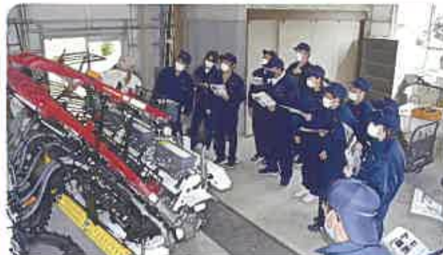
田植機の点検講習

演習機械：トラクタ、田植機、スマート農機など 資格取得：農耕用大型特殊自動車免許、刈払機安全操作講習、県農業機械士 など