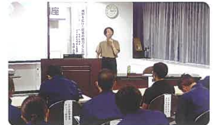
農業の魅力を発信する女性経営者による公開講座