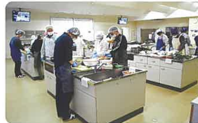
県産食材を用いた富山短期大学との調理実習交流会

カレッジの専任指導員を始め、県の研究員・普及指導員、農業高校教員、先進農家、大学関係者、農業機械・ICT等の専門家などの講師が指導します。