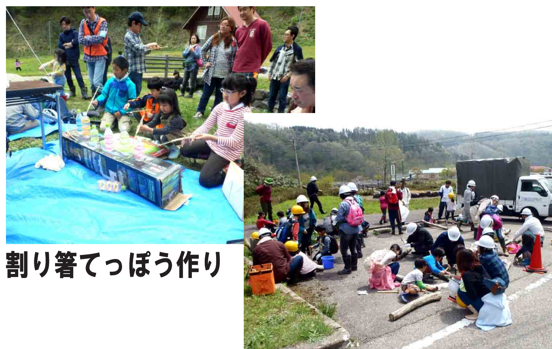
割り箸でっぼう作り