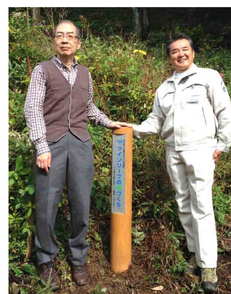
2013年～2016年 活動区域の入り口に設置した標柱