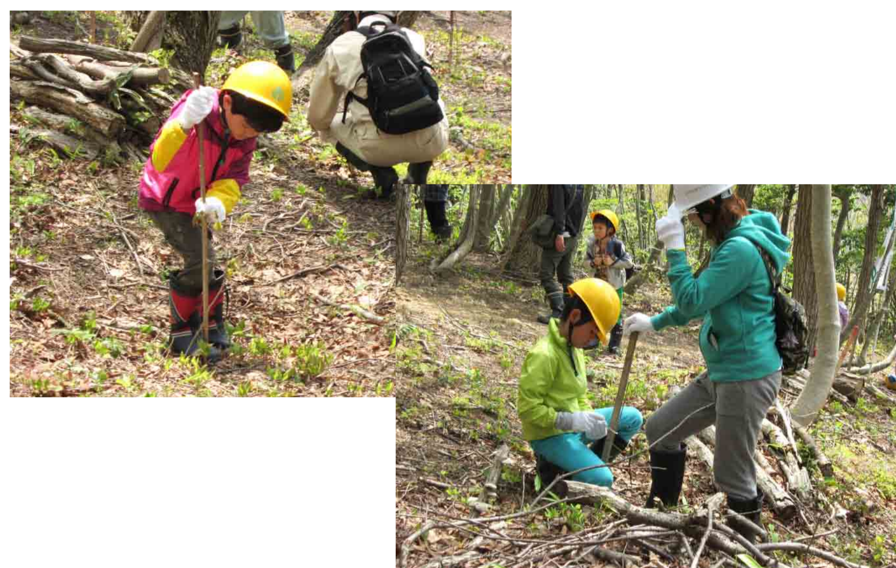
根踏みをしています