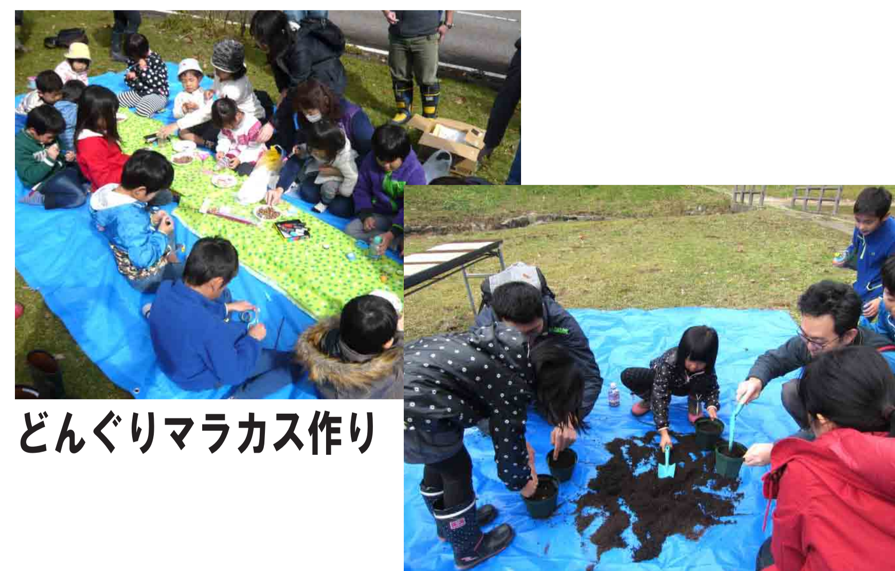
どんぐりマラカス作り