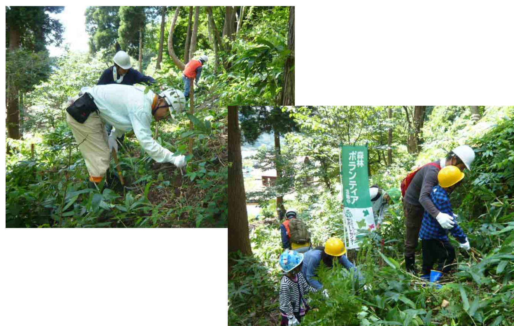
下草刈りをしています