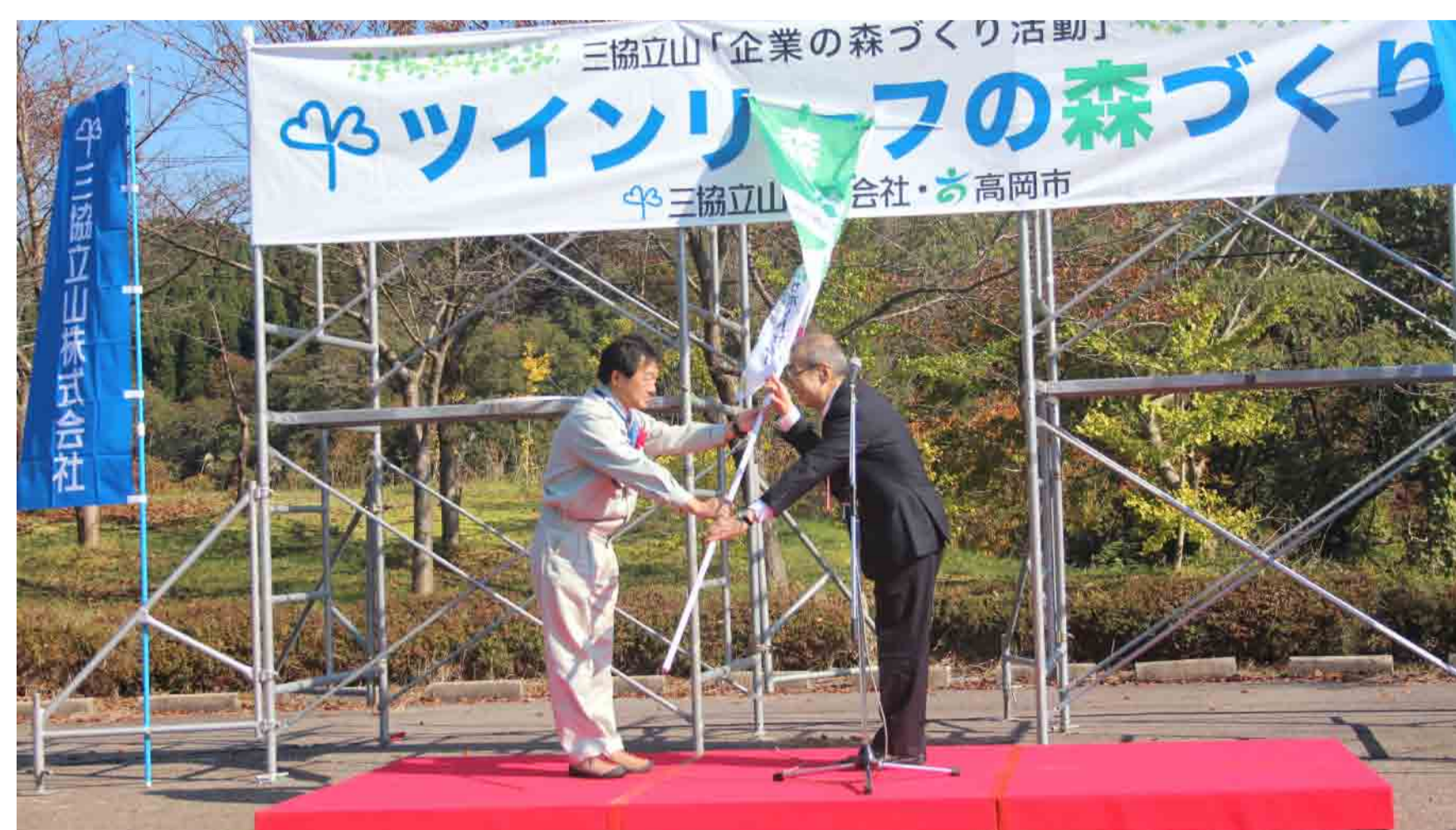
のぼり旗の贈呈（2013年）

これらの作業を従業員とその家族が森林ボランティア活動として取り組み、環境保全や社会貢献に対する意識向上を実感できるイベントとしています。