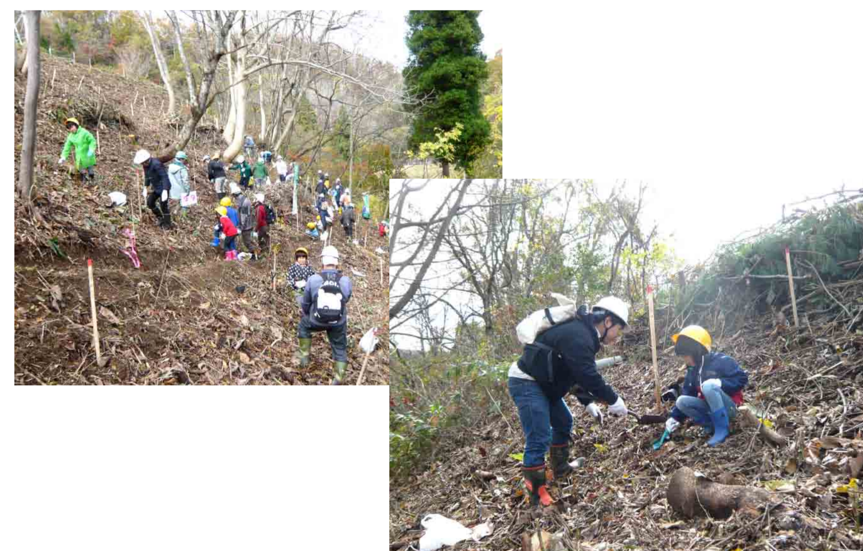
コナラを植樹しています