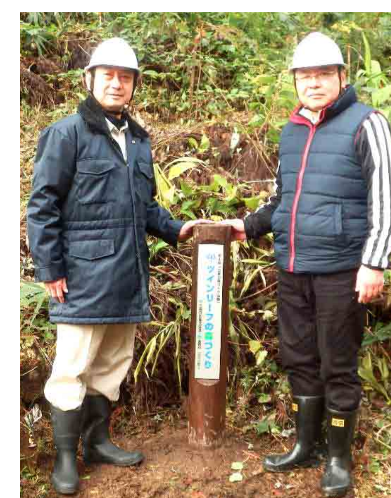
2016年～2017年 活動区域の入り口に設置した標柱