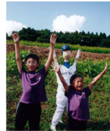
▲「棚田のイチローと」