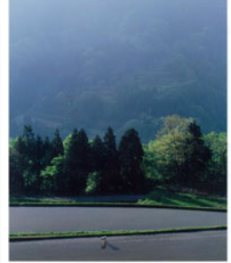
▲銅賞 「奥山の田植え」