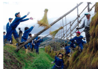
▲「しっかり取ってね！ナイスゲー」