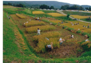
▲「棚田オーナーの稲刈り」