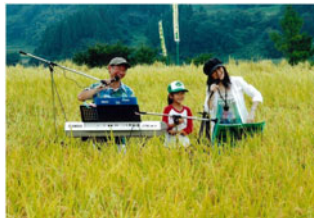
▲「棚田のコンサート」