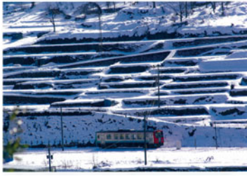
▲金賞「ローカル線と共に」