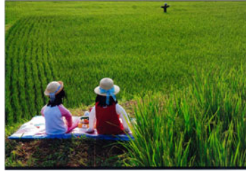
▲銅賞「かかしのピクニック」